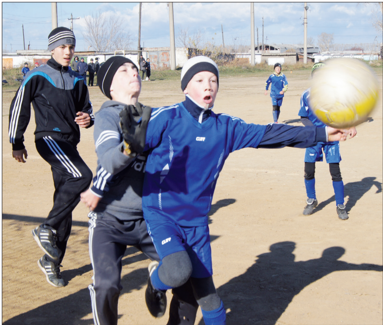
Селенгинцы впереди: «Пусть не дома мы играем, всё же бьём и забиваем!»

Следственный отдел по Кабанскому району СУ СК России по РБ.