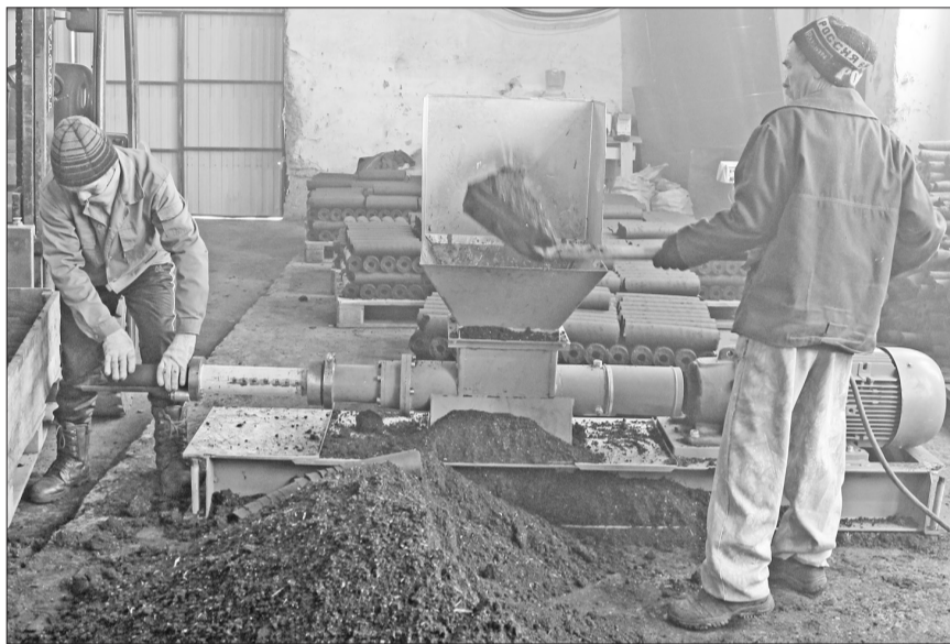
Вот он - процесс производства торфяного топлива.