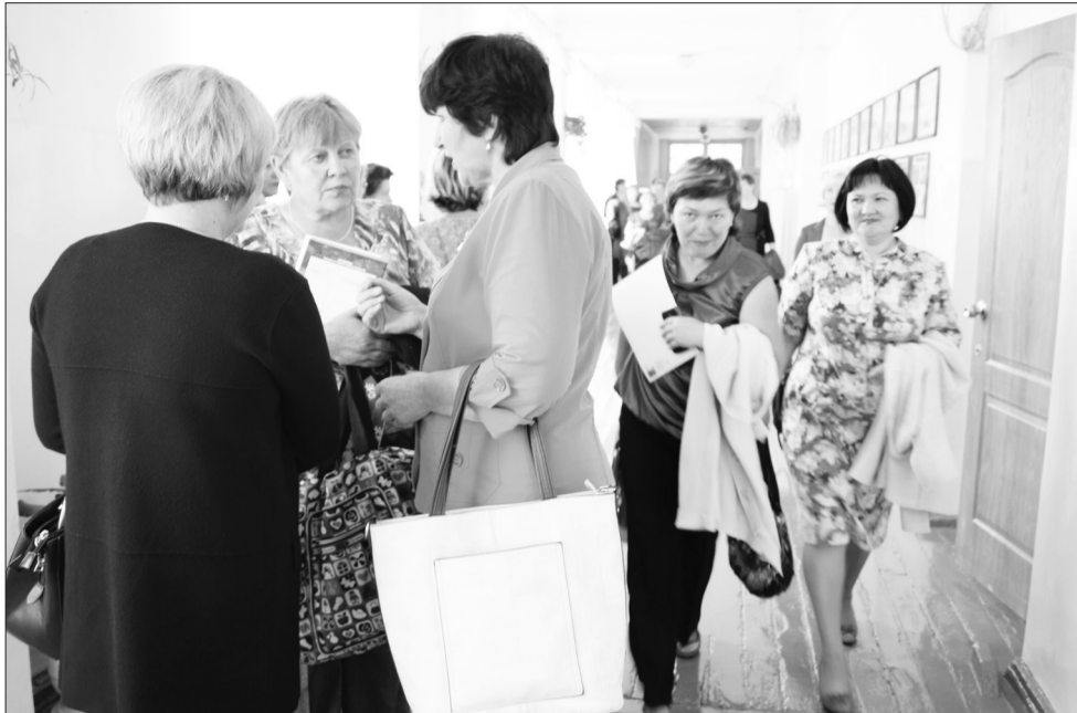
Заседание секции продолжается и в коридоре...

Таким путём идут лучшие педагоги района.