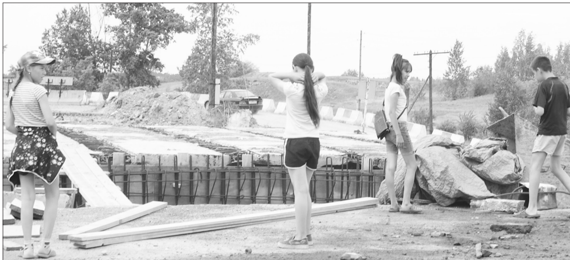
Нюкским ребятам, встречающим вечером коров, удобно с недостроенного моста высматривать своих бурёнок. Об их безопасности строители не задумываются...

К капитальному ремонту мо- ста ООО «Контакт» (организация,