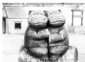
В центральном парке Кяхты установят скульптуру купца и маленьких бегемотиков

Подготовлено при поддержке Администрации Главы РБ и Правительства РБ.