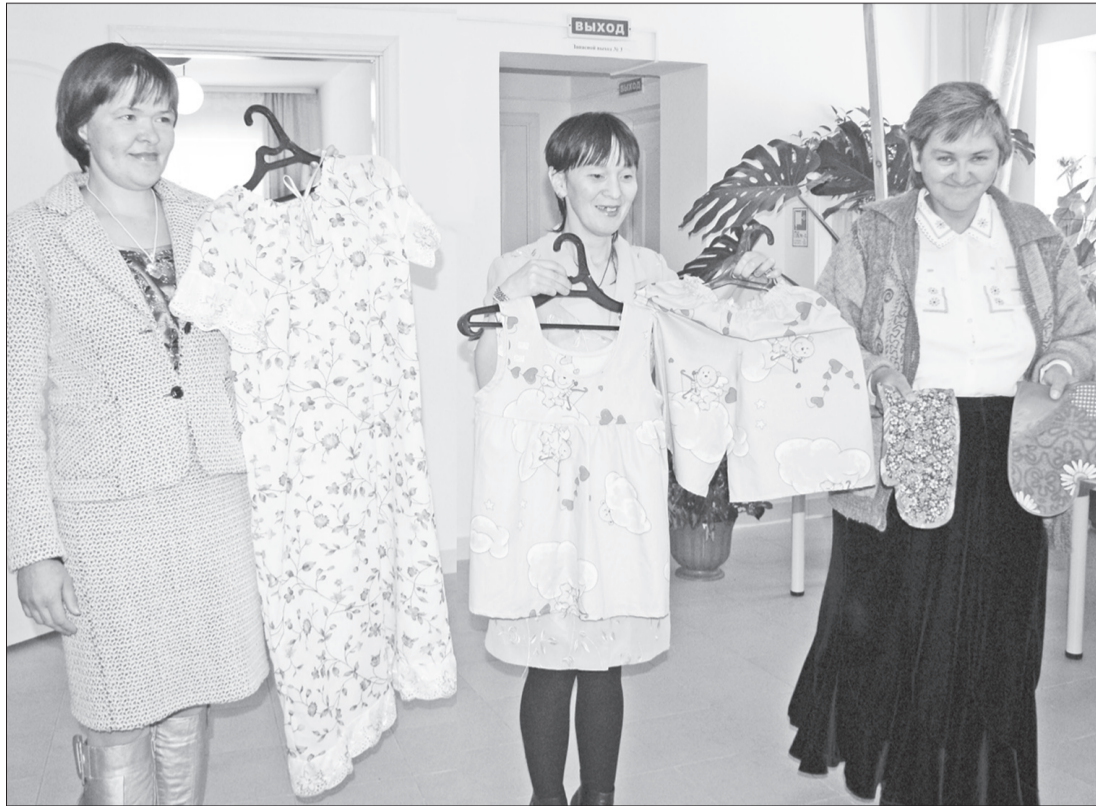
"Мы сумели сделать это!.."