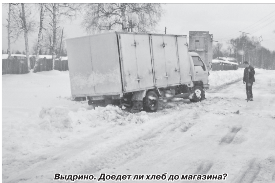
Выдрино. Доедет ли хлеб до магазина?