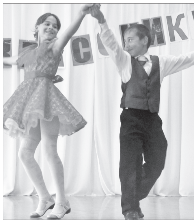
Вальсируют новоиспечённые пятиклассники.

19 октября в Кабанской школе состоялось знаменательное событие — посвящение младших учащихся в пятиклассники.