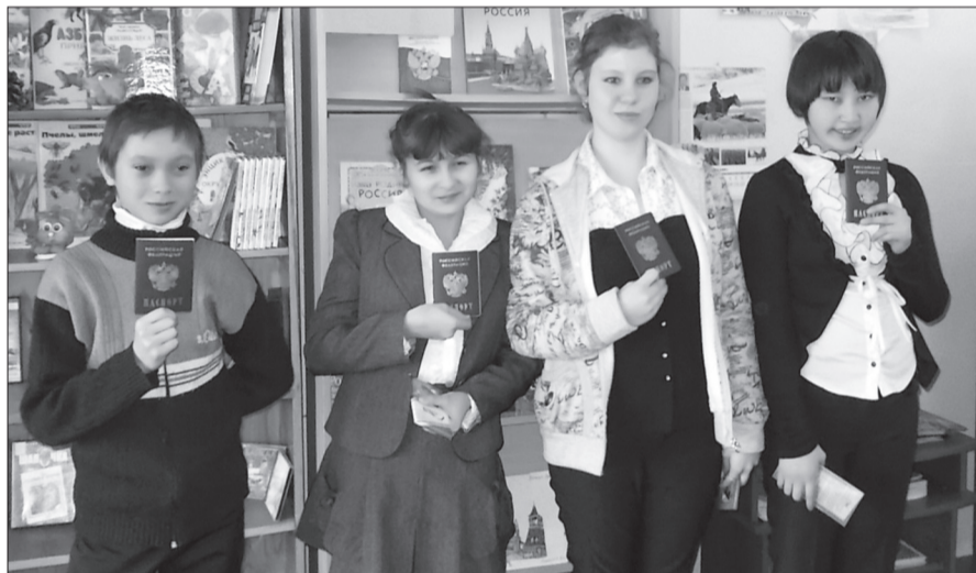
ФОТО ОТ ЧИТАТЕЛЯ

ства, стихов и прозы о Родине, о российских праздниках, рисунков школьников по данной теме.