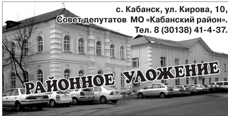
с. Кабанск, ул. Кирова, 10, Совет депутатов МО «Кабанский район». Тел. 8 (30138) 41-4-37.