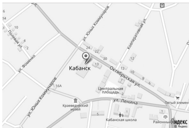
Схема проезда автотранспорта в с. Кабанске на 23 сентября 2017 года

Управление сельского хозяйства Администрации МО «Кабанский район».