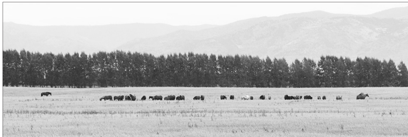
Только на одном участке овсяного поля мы обнаружили порядка сорока коней...