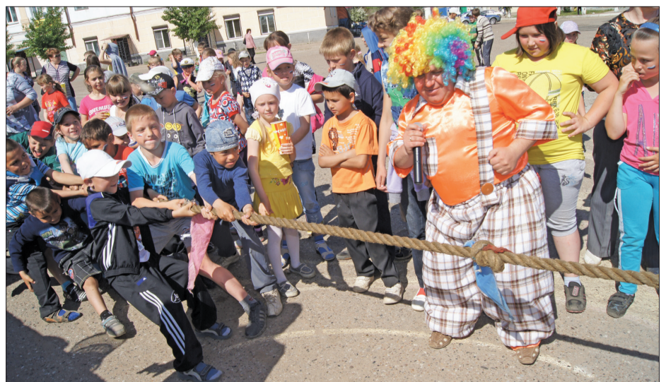
п. Каменск.

ООО "БайкалВторМет": ЗАКУПАЕМ ЦВЕТНОЙ МЕТАЛЛОМ. ДОРОГО. Медь - 160 руб/кг, нержавейка - 30 руб/кг, латунь - 70 руб/кг, алюминий - 25 руб/кг, аккумуляторы - 12 руб/кг. ЗАКУПАЕМ ЛОМ ЧЁРНЫХ МЕТАЛЛОВ. ДОРОГО. с. Брянск, ул. Истомина, 60 "б" (рядом с магазином "Берёзка"). Тел. 39-09-30, 39-09-00.