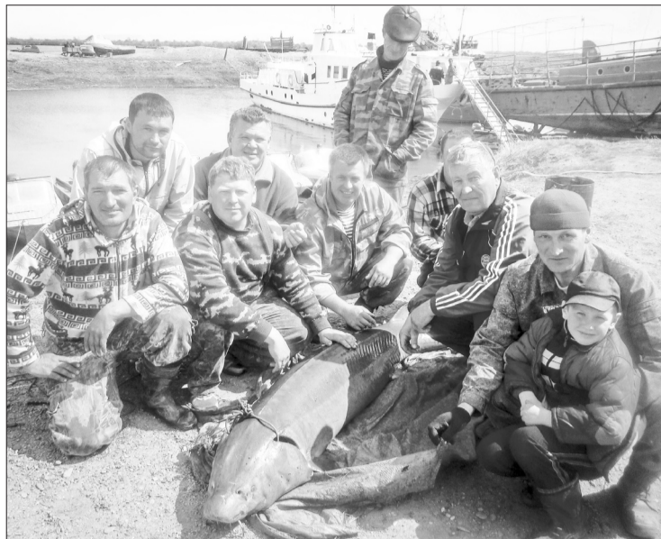
Фото на память: сотрудники Байкало-Селенгинского филиала "Байкалрыбвод" вместе с Ньюшей.

С начала работы рыбоводного комплекса в водоёмы Кабанского района было выпущено 1800 тысяч подращенной молоди сазана. В настоящее время ведутся работы по отлову сазана в Баргузинском районе, которые будут