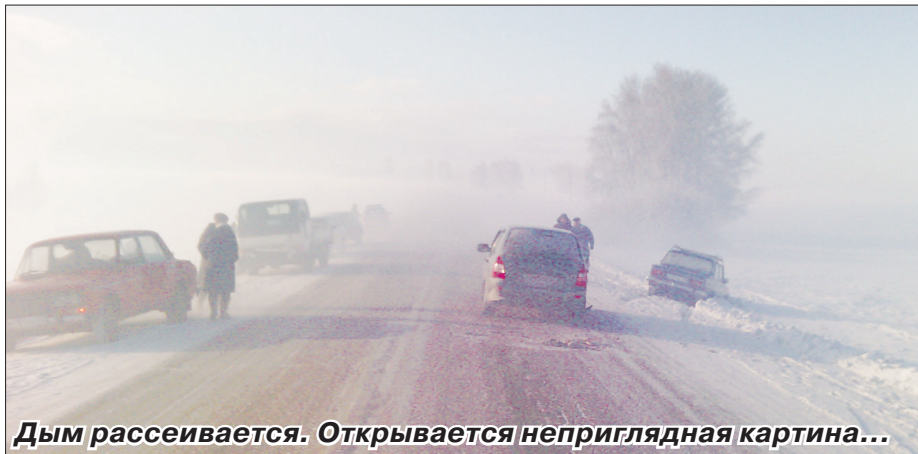
Дым рассеивается. Открывается неприглядная картина...

Несмотря на все победные рапорты властей, торфяные пожары не покидают наш район.