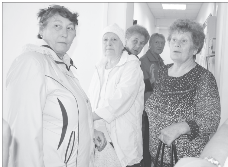
Очередь за «добавкой» к пенсии начинается с лестницы...

Если не хватает кабинетов, можно было открыть дополнительные. Наконец, можно было вызывать пенсионеров не всех сразу, а по населённым пунктам. Сегодня –