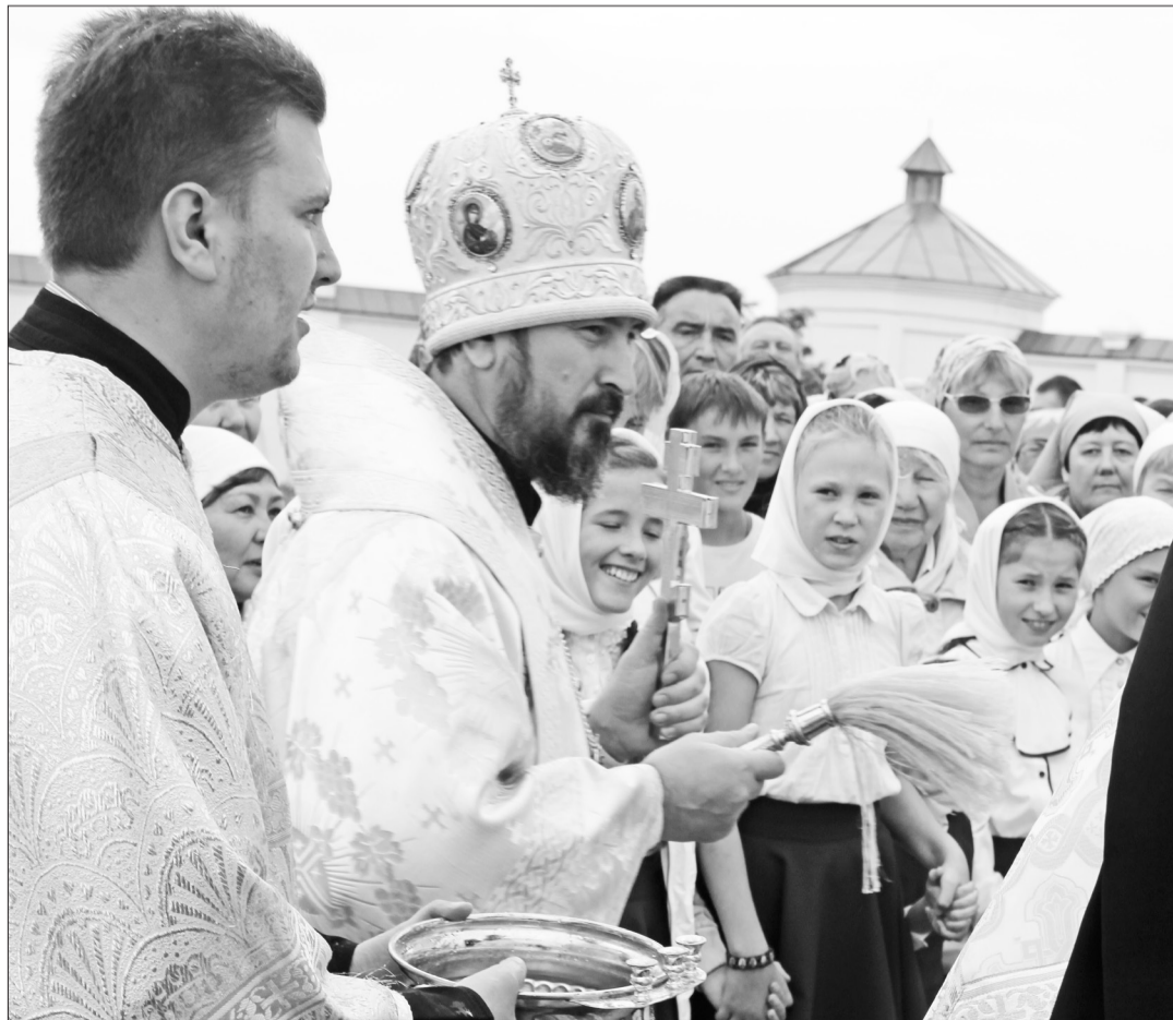
Гостей праздника поздравил митрополит Улан-Удэнской и Бурятской епархии САВВАТИЙ.