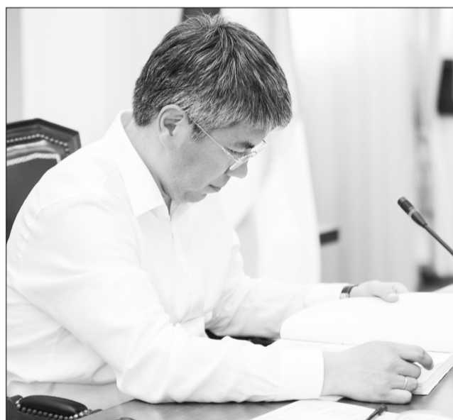
Исполняющий обязанности Главы Республики Бурятия Алексей Цыденов вместе с учеными республики определил пути развития региона до 2022 года.

щение дает хорошее здравоохранение, образование и культура. А также инфраструктура, например, хорошие дороги. Это качество жизни, — отметил Алексей Цыденов.