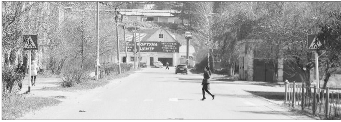
На этом пешеходном переходе произошла трагедия...