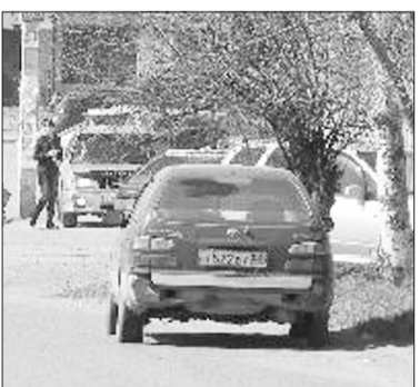
«Орудие» данного преступления.

В результате ДТП пешеход получил телесные повреждения в виде закрытой черепно-мозговой трав-