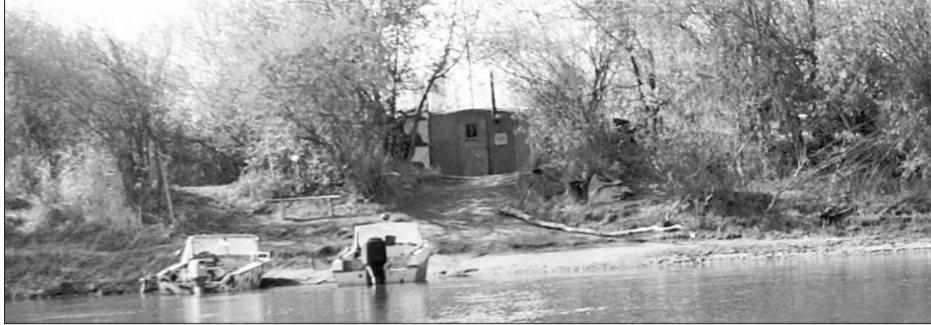
Один из восьми временных пунктов рыбоохраны, расположившихся на главной нерестовой реке в зоне ответственности Байкало-Селенгинской инспекции рыбоохраны.

- Вот и наша база, - госинспектор Селиванов выезжает на «Ниве» на укромную поляну прямо на берегу реки. К вагончику примыкает импровизированная летняя столовая. Рядом - кострище с остывающим чайником. К берегу причалены катер «Амур» и две лодки с подвесными моторами «Ямаха». - Место мы выбрали удачное, иногда браконьеры сами выходят на нас.