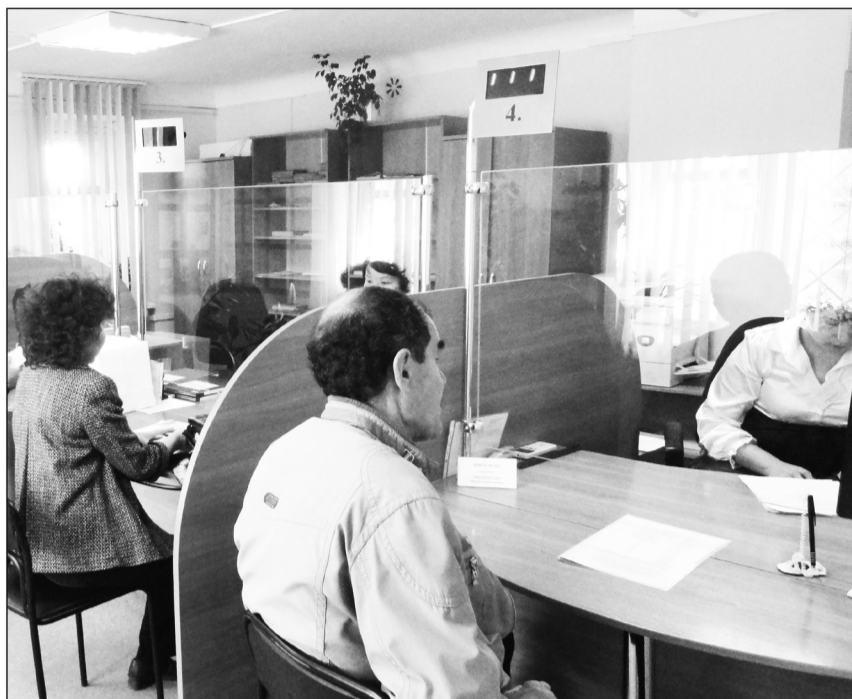
Малообеспеченным семьям предоставляются субсидия на оплату коммунальных услуг, государственное пособие и другие социальные выплаты

Вы считаете, что имеете право на помощь в антикризисном центре? Тогда вам в первую очередь необходимо обратиться в отделы социальной защиты