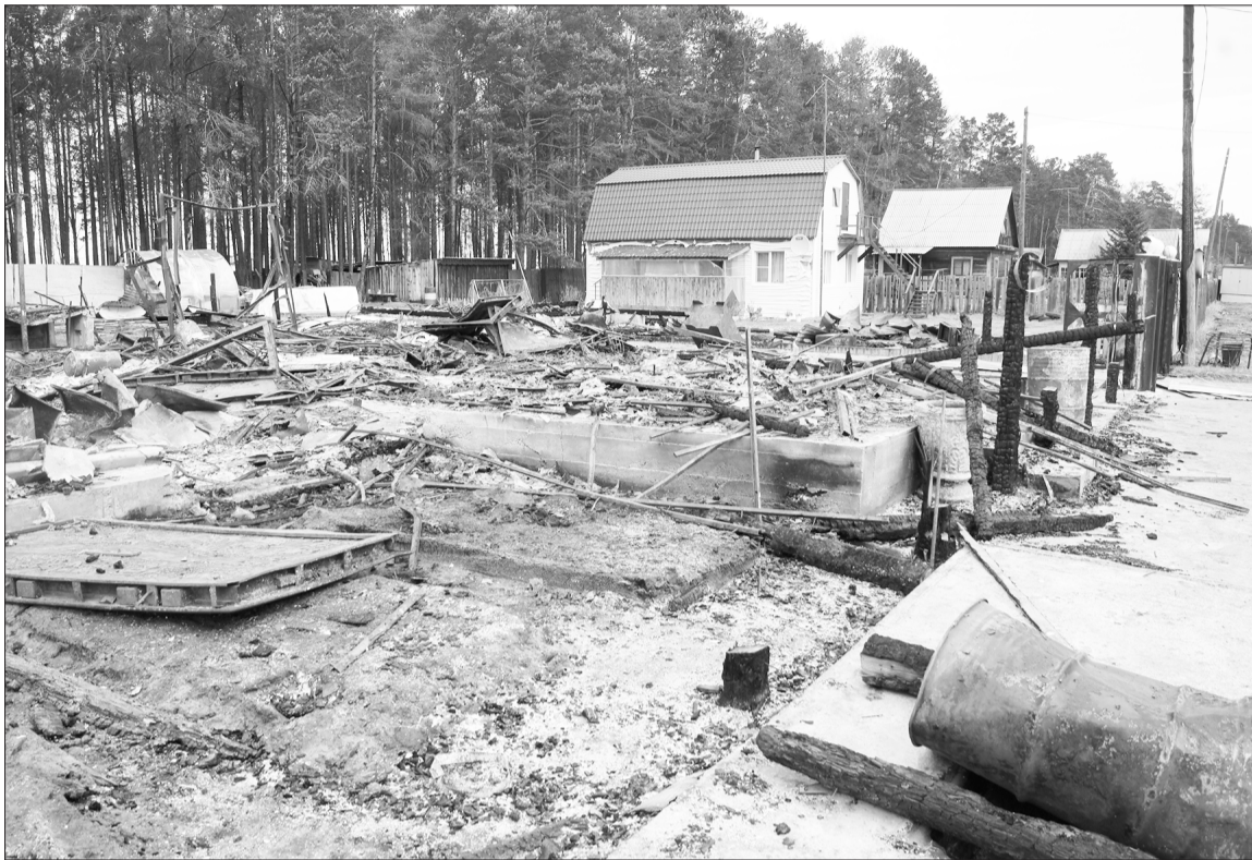
Это всё, что осталось от туристической базы «Сакура».