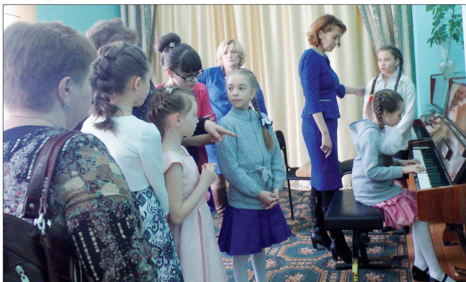
«Попробовать» инструмент в перерыве выстроилась очередь из участников.