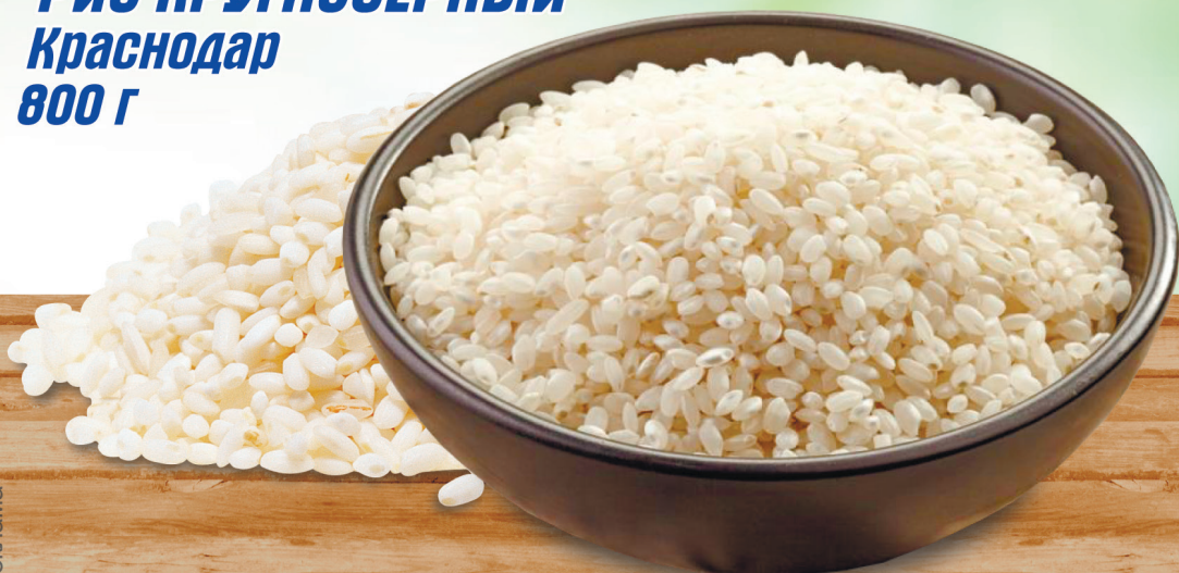
РИС КРУГЛОЗЕРНЫЙ Краснодар 800 г

ПРИГЛАШАЕМ ЗА ПОКУПКАМИ! п. Селенгинск, мкр. Южный 52