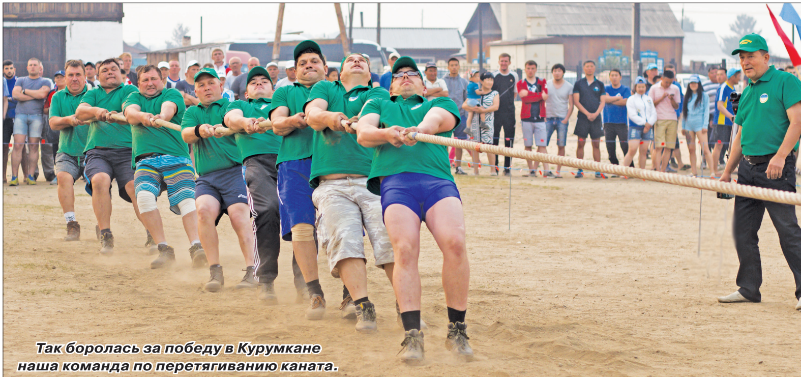
Так боролась за победу в Курумкане наша команда по перетягиванию каната.