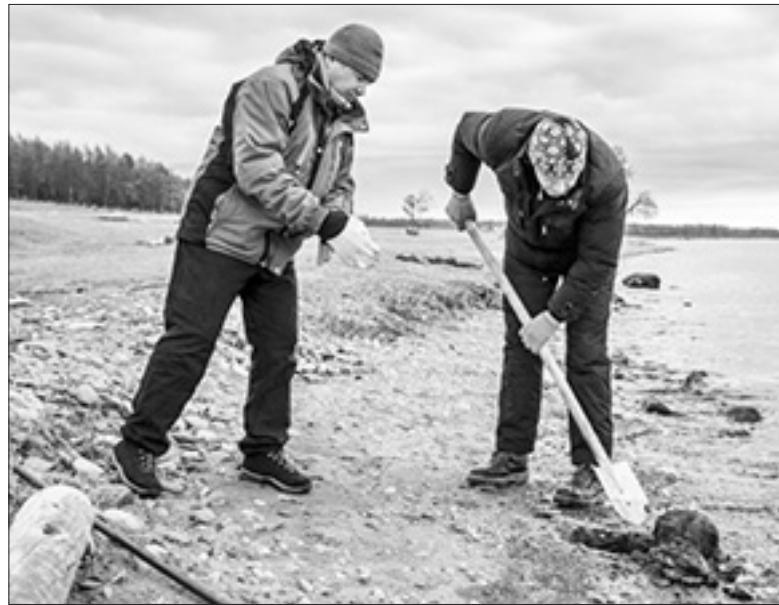
Сотрудники Лимнологического института на Байкале.

Главной причиной цветения воды полосы берегового мелководья Байкала являются изменения в режиме водостока всеми речками-притоками Байкала, протекающими по площадям лесоповалов. Механизм таков. До осуществления лесоповалов верховья всех притоков Байкала имели тысячелетиями сложившийся режим водостока, при котором верховья были аккумуляторами влаги очень большой ёмкости.