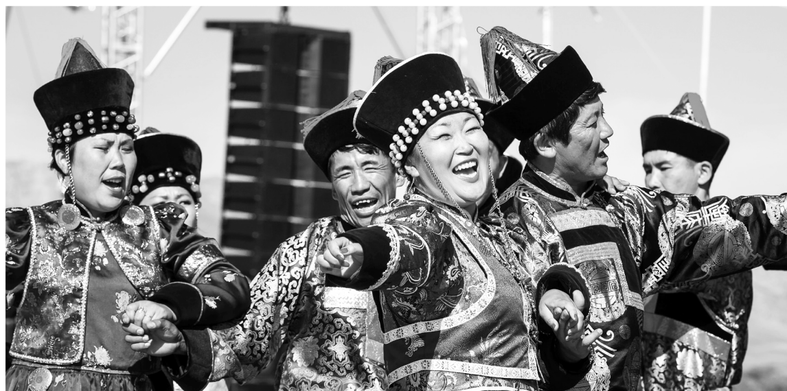
В Алтаргане-2016 примет участие 2 тысячи артистов. Программа фестиваля включает 14 творческих конкурсов