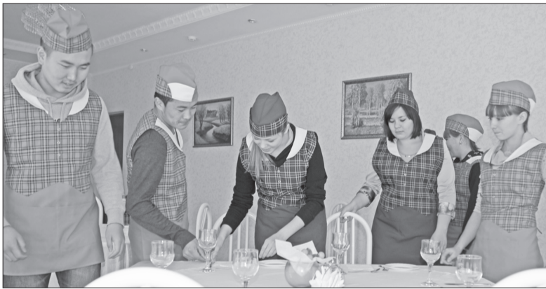
Монгольские и русские студенты вместе осваивают нелёгкое искусство сервировки стола.