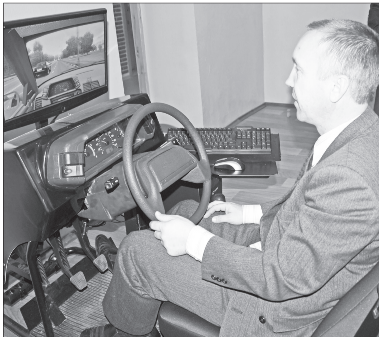
Единственный в районе компьютерный автотренажёр позволяет готовить водителей-профессионалов.