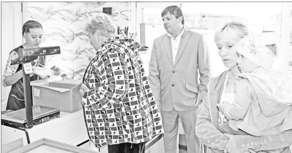
Почти каждый день «генеральный» ООО «Рыбопродукт-2» бывает в своих торговых точках, изучает запросы и оценки покупателей.

Во-вторых, постоянная работа над ассортиментом выпускаемой продукции. Из омуля мы делаем продукцию