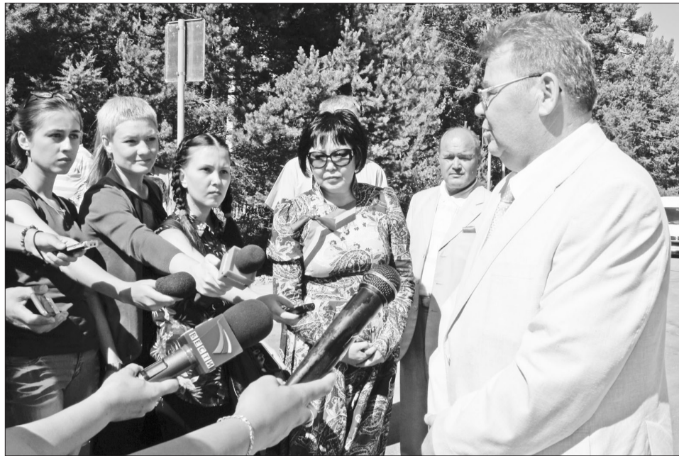
Дорога к Новому Энхэлuku и визит заместителя председателя Правительства РБ Н.М. ЗУБАРЕВА весьма заинтересовал республиканскую прессу.

Многие выступающие на открытии дороги говорили, что о подъезде к Энхэлuku туристы мечтали давно. Коренных жителей в посёлке Энхэлук осталось 125 человек. Их теснят шикарные гостевые дома, самый дешё-