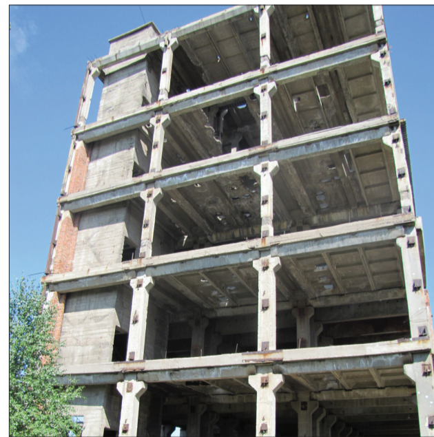
Тот самый шестой этаж...

Чем заканчиваются неизвестные нам игры наших детей?