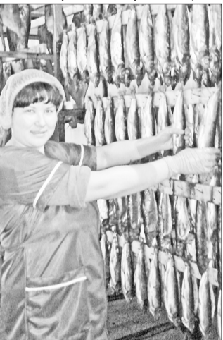
В копильном цехе.

- На сегодня мы открыли семь павильонов: три – в Кабанском районе, два – в Прибайкалье, также двумя торговыми точками зашли на рынок Улан-Удэ. Останавливаться не собираемся. При этом, от-