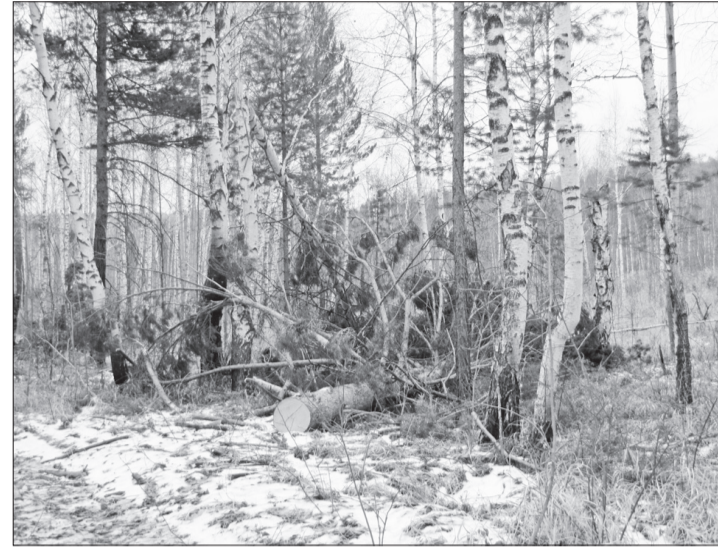
На месте преступления...

«Чёрные лесорубы» хозяйничают недалеко от детского лагеря «Орлёнок»