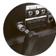
Присоединение антенны к цифровому телевизионному приемнику