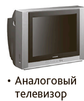
• Аналоговый телевизор

Приобрести ресиверы можно в розничной торговой сети. Если на разных телевизорах вы хотите смотреть разные каналы, то необходимо приобрести приставку к каждому телевизионному приемнику.