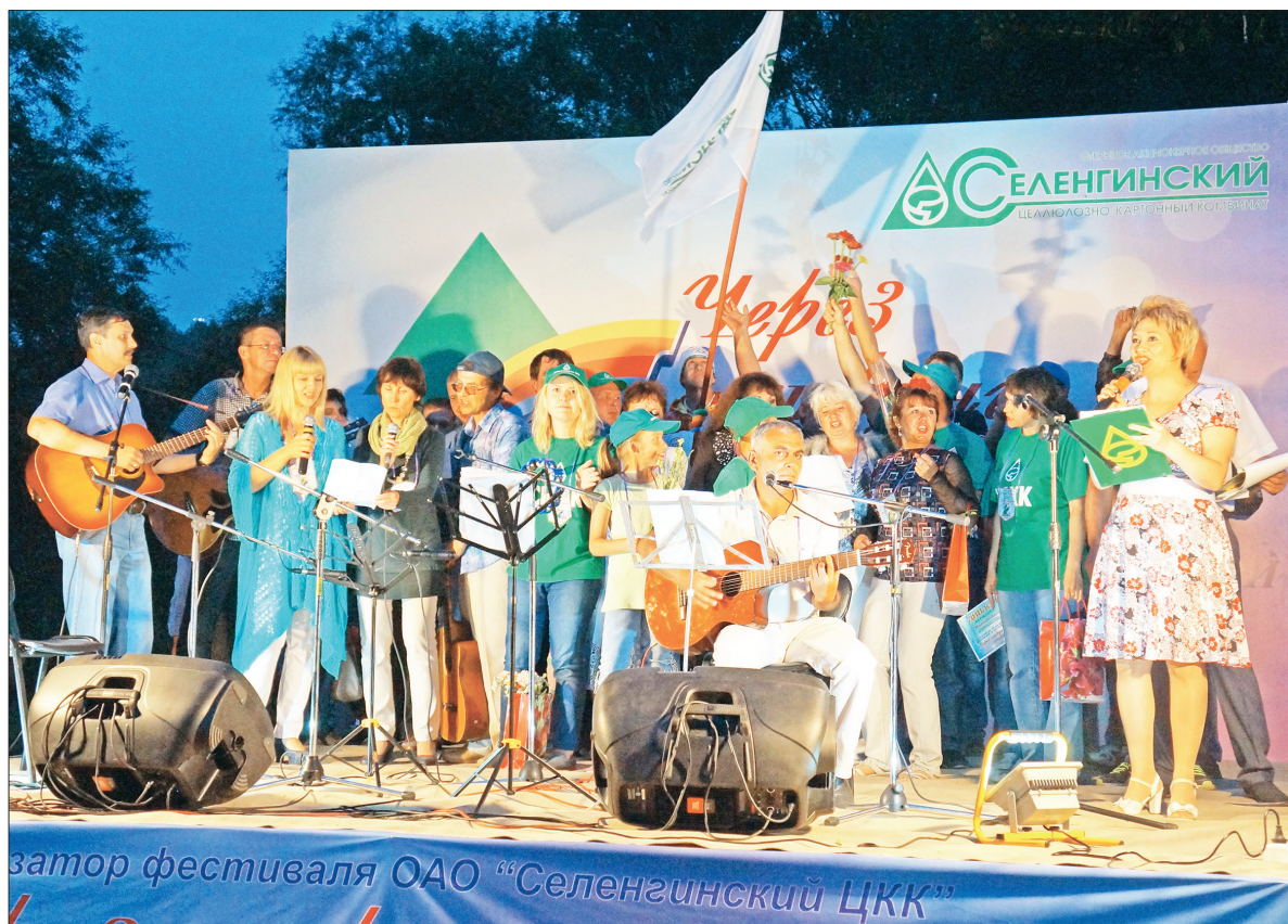
Участники фестиваля исполняют финальную песню.

29 июля в посёлке Селенгинск прошёл второй фестиваль бардовской песни “Через струны к душе”. Организатором музыкального вечера традиционно стал Селенгинский целлюлозно-картонный комбинат. В этом году фестиваль бардовской песни посвятили советской и российской киноиндустрии, а точнее тем фильмам, в которых звучат песни знаменитых бардов - Булата Окуджавы, Владимира Высоцкого, Юрия Визбора.