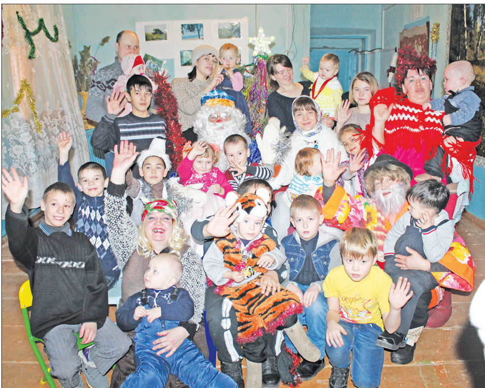
Снимок на память: юные шерашовцы со сказочными персонажами.

13 января в селе Шерашово прошёл праздник для детей и взрослых.