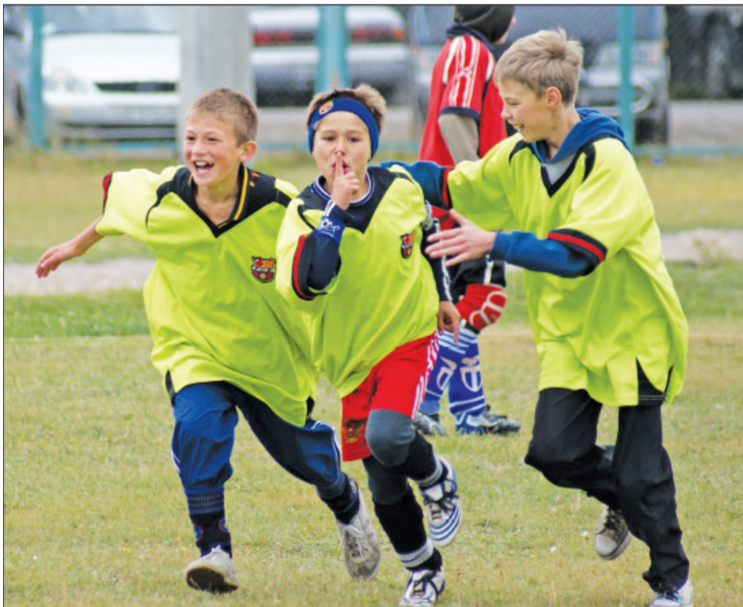
Эти фотографии сделаны в разные годы: в детском саду № 16 с. Кабанска, перед ЕГЭ в Селенгинской школе №2, а ликующих каменных мальчишек - во время фестиваля дворового футбола на призы «Байкальских огней».