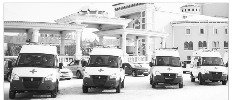
По материалам пресс-службы Администрации Главы и Правительства РБ.