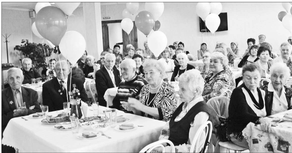
Так ветераны Селенгинска отмечают День пожилого человека.

«Нас повысили», – весело шутили члены селенгинского Совета ветеранов на открытии своего нового офиса.