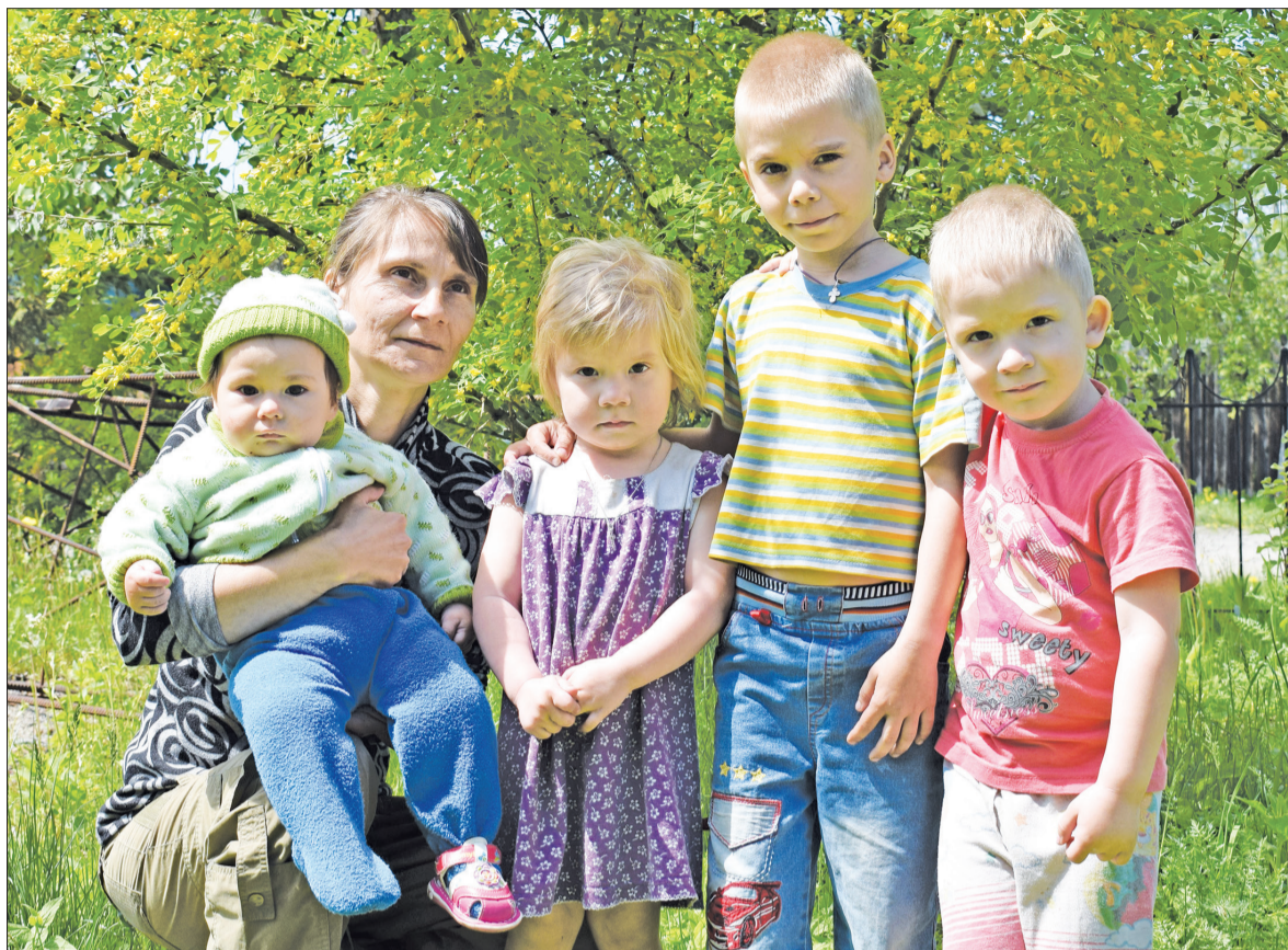
«Статус временного убежища - почти то же, что статус беженца, только беженцам предоставляют дом и работу, а нам положено только бесплатное проживание, медицинское обслуживание и подобное»...

ного убежища мне с детьми предоставили номер в хостеле, в котором на протяжении двух лет мы жили на полном обеспечении Российской Федерации.