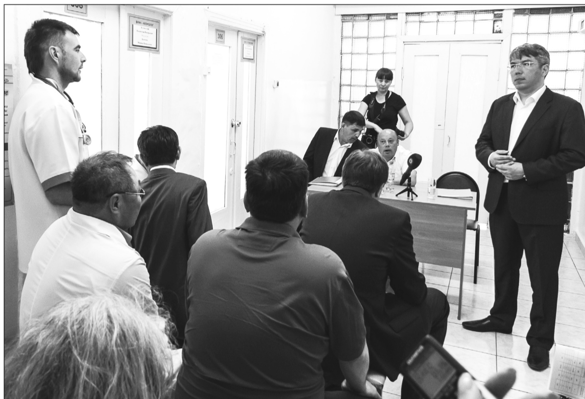
Медработники Мухоршибирского района обсудили на встрече с Алексеем Цыденовым планы строительства и ремонта медицинских учреждений.

Обязательными и традиционными в рабочих поездках руководства Бурятии по районам республики стали встречи с медицинскими работниками