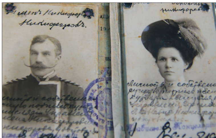
Фотографиям её родителей больше ста лет...