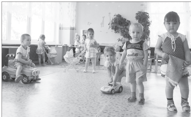
Тепло и светло малышам в детском саду «Лесная сказка».

ществует уже 25 лет, но за это время никто не делал нам таких больших подарков!»